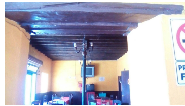
Techo con vigas originales de la Casa-habitación.