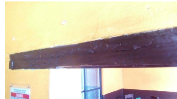
Marco de madera original de la puerta.