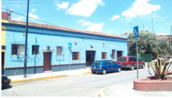
Vista panorámica de la Casa-habitación.

Entre los materiales de construcción se observan adobe, arcilla y mamposteo de piedra, actualmente aplanado, piso de solera y techado de teja roja sobre vigas de madera. Al interior, se ubican pilares de madera con base de piedra de cantera que apoyan en algún punto a las vigas del techo. Se observan marcos genuinos de madera en puertas y ventanas. Actualmente, alberga un comercio tipo restaurante.