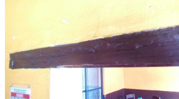
Marco de madera original de la puerta.