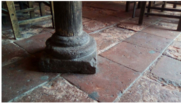
Piso de solera y pilar con base de piedra de la Casa-habitación.