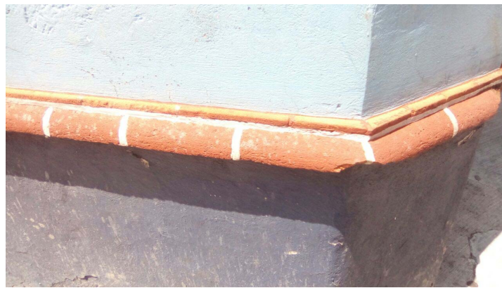
Detalle del exterior.