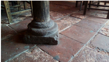
Piso de solera y pilar con base de piedra de la Casa-habitación.