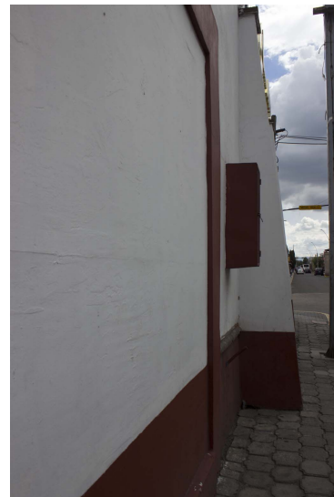
Detalle del pilar y el cimiento de campana.