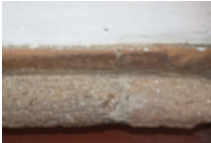
Piedra de cantera.