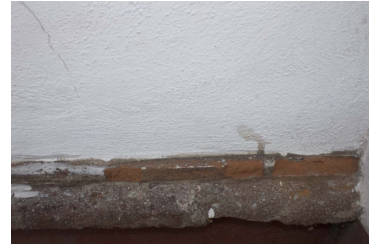
Detalle de la piedra de cantera.