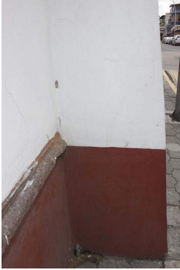
Contorno de piedra de cantera.