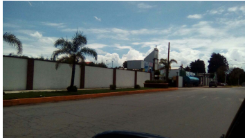
Vista lateral del inmueble.

Con una fachada sencilla que aún conserva su naturaleza de ex hacienda, en su composición arquitectónica se aprecian dos semi arcos enmarcados por columnas de doble moldura sin ornamento. En medio de ellos, cuatro pilares en cada lado contienen un amplio espacio extendido de manera vertical, dividido en tres cuerpos que se han destinado para el módulo de control de acceso al club. Ahí mismo, en la parte más elevada del inmueble, se aprecia una suerte de montículo coronado por una cruz de piedra. Hacia el interior, se aprecia que son conservadas algunas piezas originales de la construcción, como son elementos del casco, distintos pilares, techado de vigas barnizadas, bardas y pasillos empedrados.