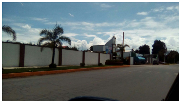
Vista lateral del inmueble.