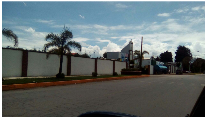
Vista completa del lateral del inmueble.