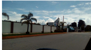
Vista lateral del inmueble.